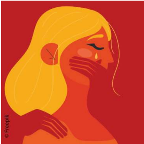
Ces visuels sont issus de la campagne du BICE contre les violences faites aux enfants.